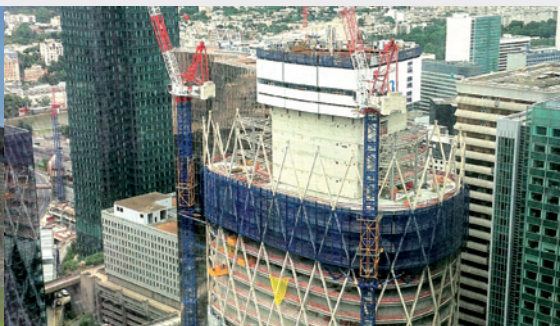
Tour D2 - La Défense