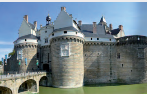
Chateau des Ducs de Bretagne - Nantes