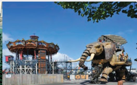
Les Mondes Marins - Nantes