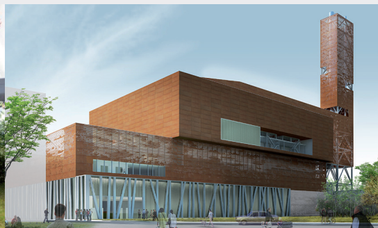
Centre de valorisation des déchets SYCTOM - Paris