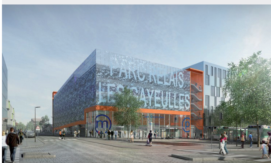
Station de métro Les Gayeulles - Rennes