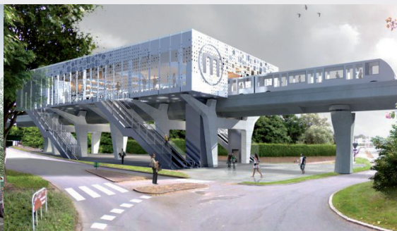
Station de métro Atalante - Rennes