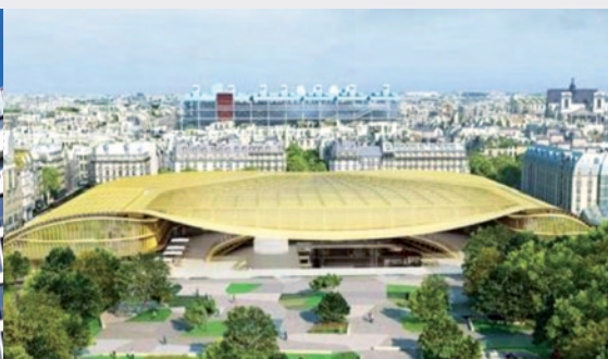
La Canopée - Les Halles Paris 1 er