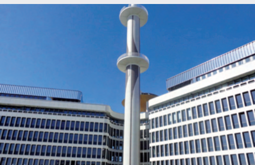
La Mabilais - Rennes